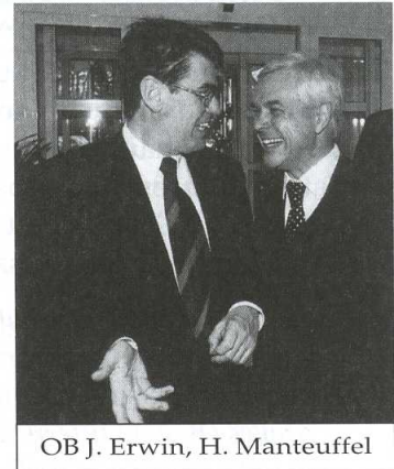
OB J. Erwin, H. Manteuffel

„Als Oberbürgermeister freue ich mich, daß ein so bedeutender Preis in Düsseldorf verliehen wird und daß 'markt intern' - als Anwalt des Mittelstands - diesen Preis vergibt. Ich bin mir sicher, gäbe es mehr solche Anwälte wie 'markt intern', ginge es dem Mittelstand deutlich besser. Anlässlich einer solchen Veranstaltung fragt man sich natürlich, was kann ein Oberbürgermeister für den Mittelstand tun? Nun, wir haben z.B. für den Einzelhandel - wenn ich diesen Teil des Mittelstandes einmal herausnehme - ganz klar entschieden, daß wir keine großflächigen Verbrauchermärkte auf der Grünen Wiese mehr zulassen und die Zugänglichkeit der Innenstädte verbessern. Dies heißt nicht nur, daß wir die Wegführung ausbauen, sondern auch die Voraussetzungen für zusätzliche Stellplätze schaffen und die Parkgebühren senken. Zudem haben wir 4 neue Scouts speziell für den Mittelstand beim Amt für Wirtschaftsförderung bereitgestellt und brandaktuell die Senkung der Gewerbesteuer beschlossen.“